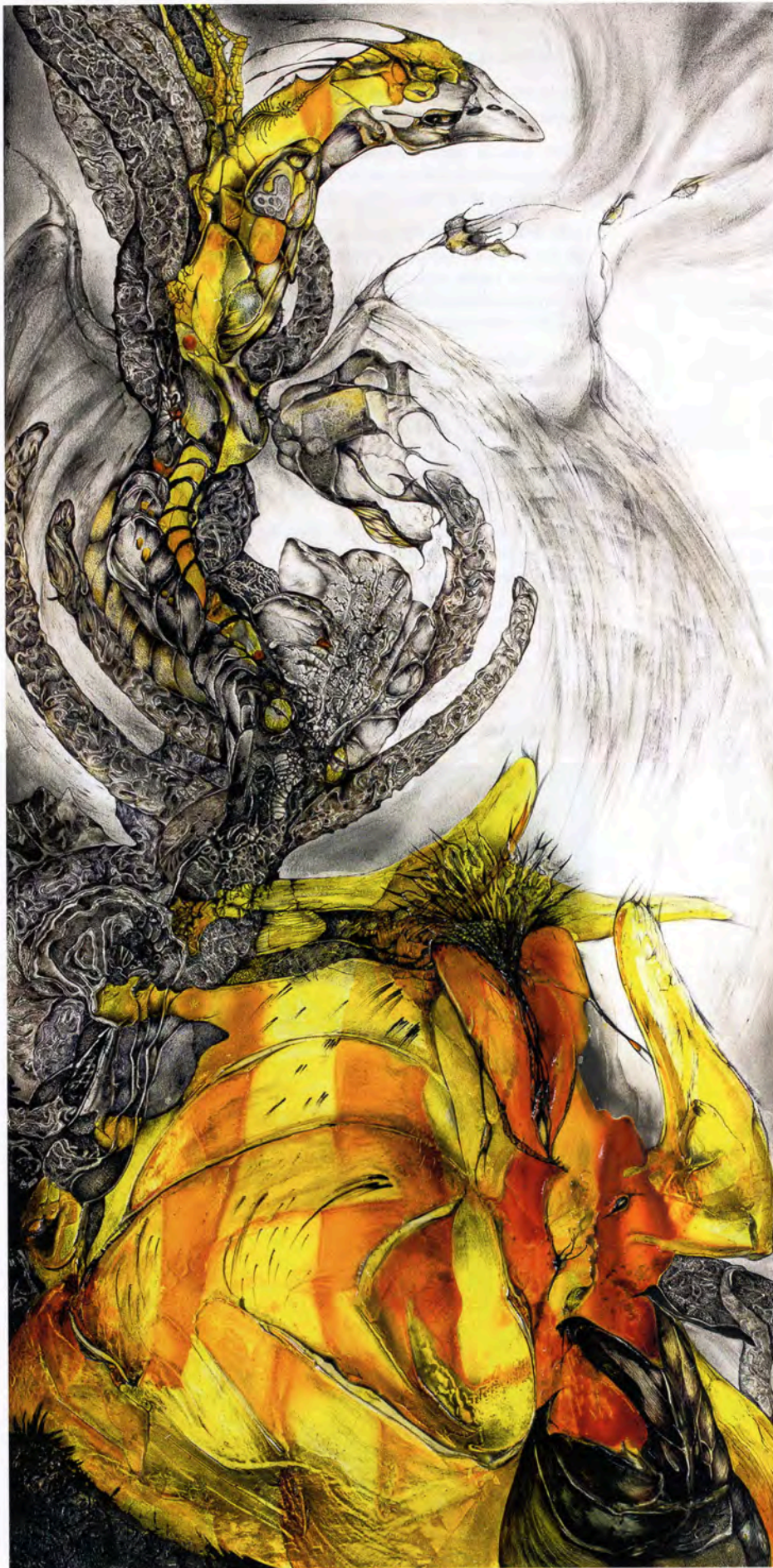
Eros, Le Dragon et l'Orchidée dorée technique mixte, 110 x 55 cm, 2014

des techniques mixtes adjoignant à l'encre de nombreux auxiliaires de toute nature destinés à en exploiter le potentiel. Toujours réalisées sur des assemblages de papier, ce sont des œuvres de grande taille, douées d'étonnants reliefs, qui finissent par prendre place dans sa très restreinte production. Un seul de ses tableaux peut exiger jusqu'à cinq mois de travail avant achèvement.