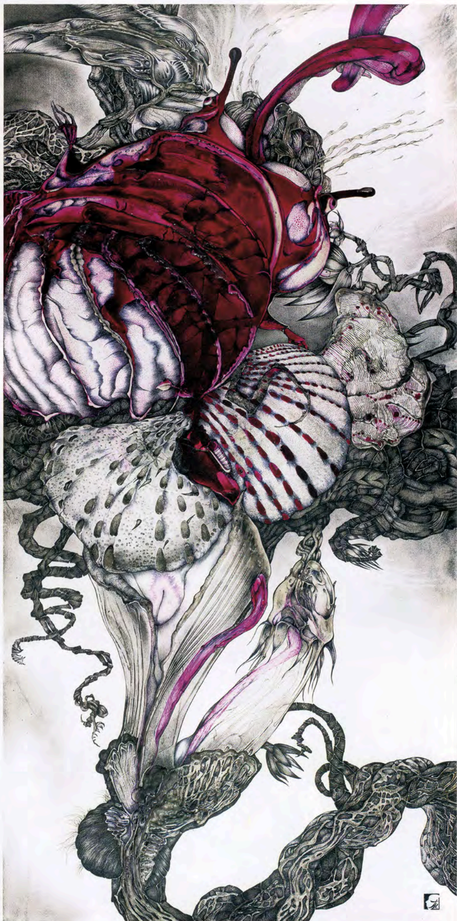
Eros, Le Baiser et l'Orchidée pourpre technique mixte, 110 x 55 cm, 2013