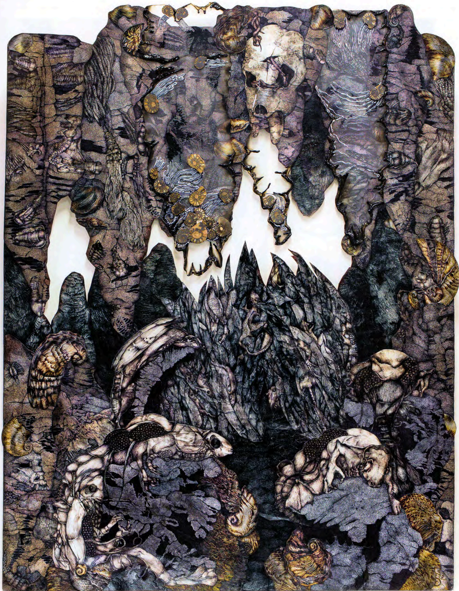
Le Commencement, La Grotte technique mixte, 103 x 80 cm, 2015