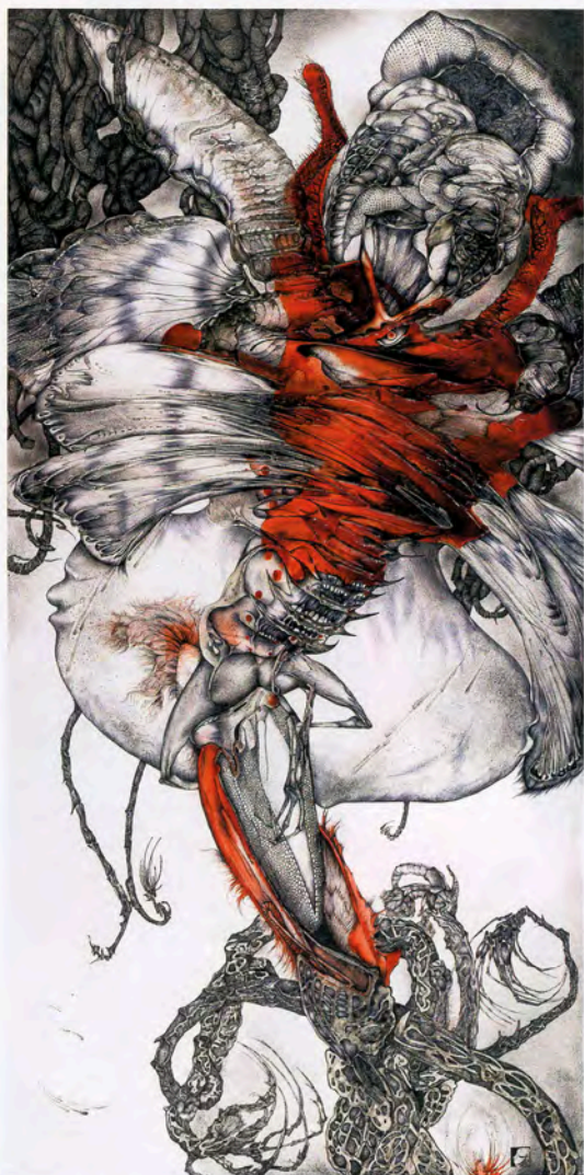
Eros, Le Colibri et l'Orchidée Vermillon technique mixte, 110 x 55 cm, 2014